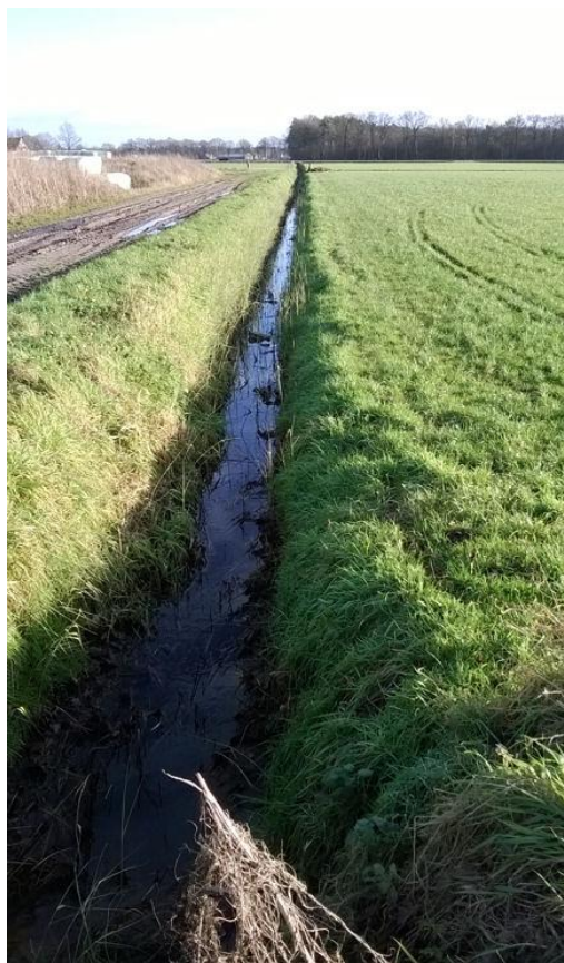
De markegrens Oele-Beckum vanaf de Geurdsweg, richting Haaksbergerstraat.

5 H. Reynders, 'Een drie-markenpunt', Oald Hengel, februari 1985, pagina 19.